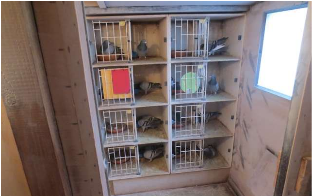
binnenzicht hok kwekers